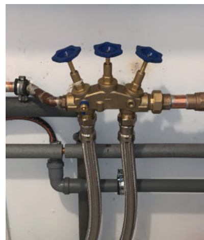
Bypass zum Anschluss mit Panzerschläuchen

Haben Sie Interesse an unseren Produkten oder Fragen dazu?